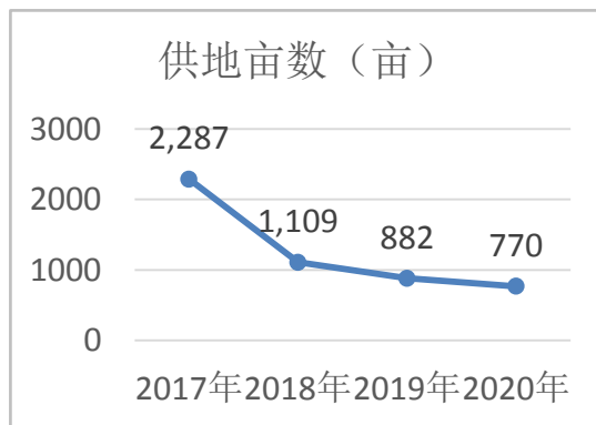
图 2：产业用地面积出让情况