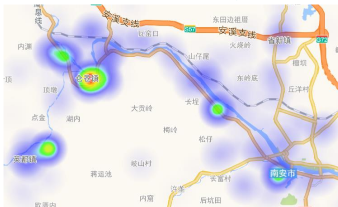
图 5.南安市阀门产业热力分布图

由图 5 可以看出，南安阀门中小微企业众多，主要分布在仓苍、英都、美林、溪美等区域，据了解中小微阀门生产企业有 70 余家，分布比较分散。