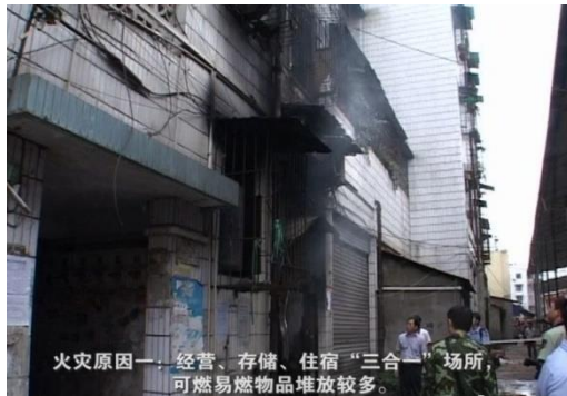
图 6：“三合一”场所火灾事故