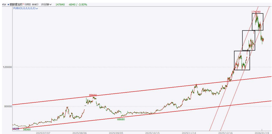
图 4：碳酸锂价格高位回落调整

碳酸锂价格高位回落调整。 2025 年 12 月中旬至 2026 年 1 月上旬，碳酸锂价格进入加速上涨通道，短期暴涨至最高点 174060 元/吨。2026 年 1 月中旬，碳酸锂价格向下跌破 157000-174000 元/吨区间下沿，且向下跌破加速上涨通道，涨势放缓，高位回落调整。