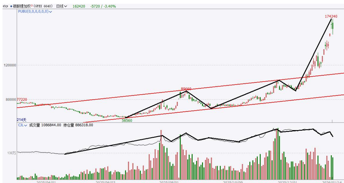
图 1: 空头止损助推价格加速上涨, 多头在价格高位顺势止盈

空头止损助推价格加速上涨,多头在价格高位顺势止盈。 2025年12月,盘面空头止损加速碳酸锂价格上涨,价格脱离原上涨通道,短期出现暴涨。2026年1月上旬,多头继续增仓拉涨,碳酸锂价格快速攀升至174000元/吨以上,盘面空头陆续止损离场,部分多头资本在价格高位顺势止盈,盘面持仓量由111.9万手下降至88.6万手。2026年1月9日,碳酸锂收盘价96420元/吨,较上月同期81640元/吨上涨18%。