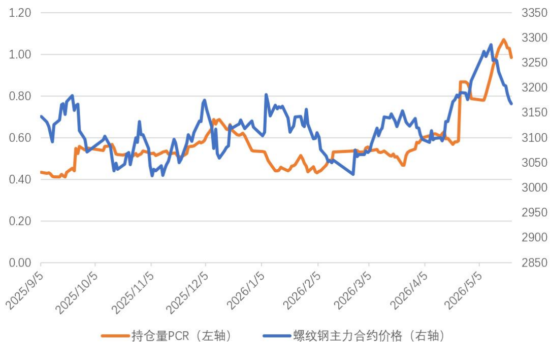
图 4：螺纹钢期权持仓量 PCR