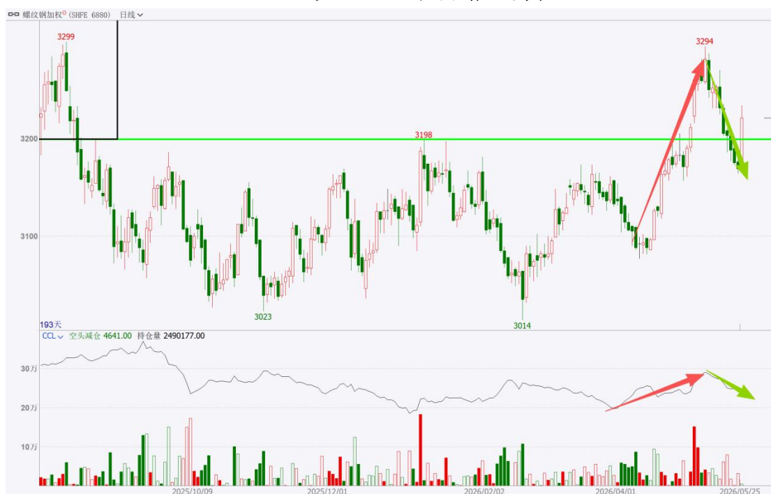
图 1：多头主导价格走势